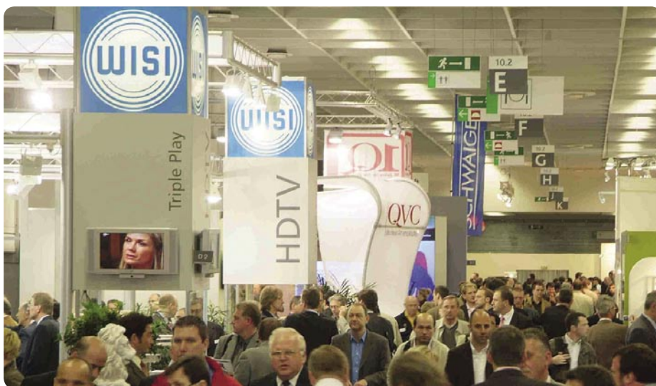
El tráfico de visitantes en la pasada muestra de ANGA que en el 2007 mostrará una imagen similar.

Las Redes de Nueva Generación, DOCSIS 3.0 e IP-TV son algunas de las palabras claves en este nuevo campo.