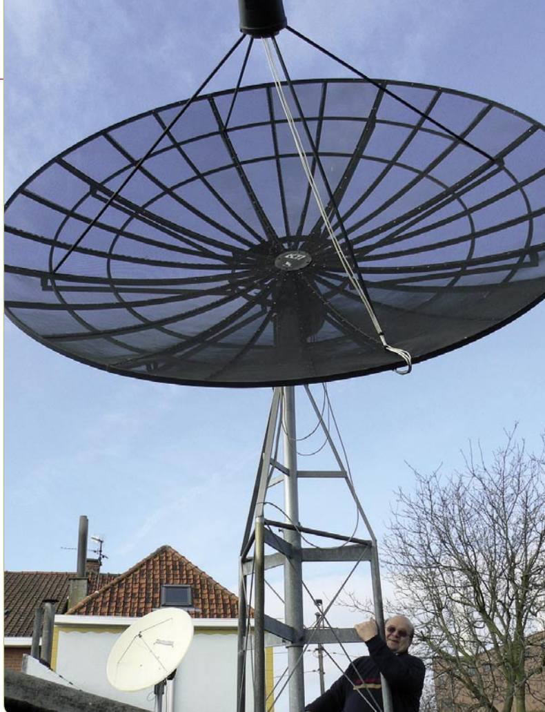
La antena de Aimé es tan grande que apenas se ve en la foto la cabeza del LNB (arriba) y la cabeza de Aimés (abajo). En el lado izquierdo en el fondo se puede ver otro plato de 1.8 m con motor para la banda Ku.

Dirk Van Honacker delante de su TV de pantalla plana de Philips. "Actualmente los canales HDTV más buenos se ofrecen por Sky en Gran Bretaña."