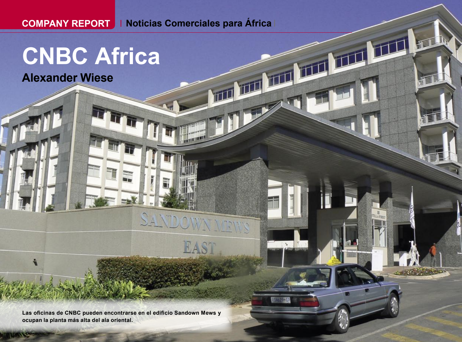
Las oficinas de CNBC pueden encontrarse en el edificio Sandown Mews y ocupan la planta más alta del ala oriental.