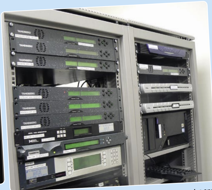
Las señales se procesan aquí. Las ranuras de Tandberg son para las operaciones del satélite. Las ranuras para los enlaces de microondas terrestres enlazan con SENTECH, el proveedor de servicios de Sudáfrica para la distribución de las señales.