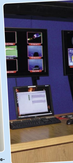
Freddy es uno de los operadores. De aquí la señal va a los satélites.