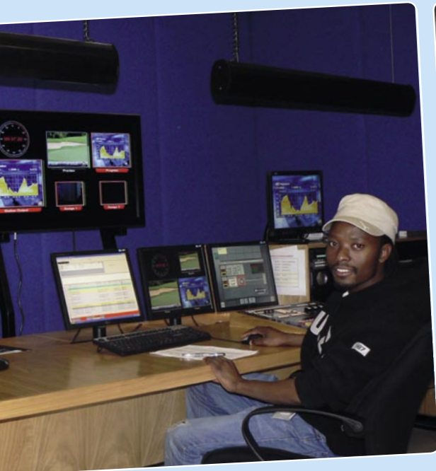
Operadores en el Centro Final de Control. satélites.