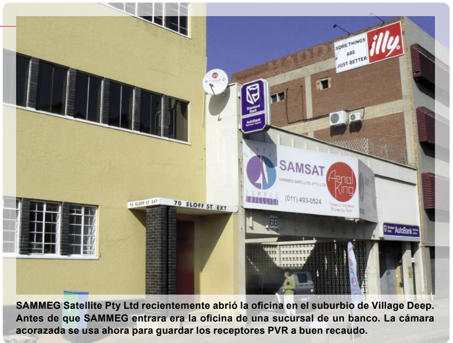
SAMMEG Satellite Pty Ltd recientemente abrió la oficina en el suburbio de Village Deep. Antes de que SAMMEG entrara era la oficina de una sucursal de un banco. La cámara acorazada se usa ahora para guardar los receptores PVR a buen recaudo.

¡La Copa Mundial de Fútbol que tendrá lugar en el 2010 en Johannesburgo le deja un futuro muy optimista al satélite!