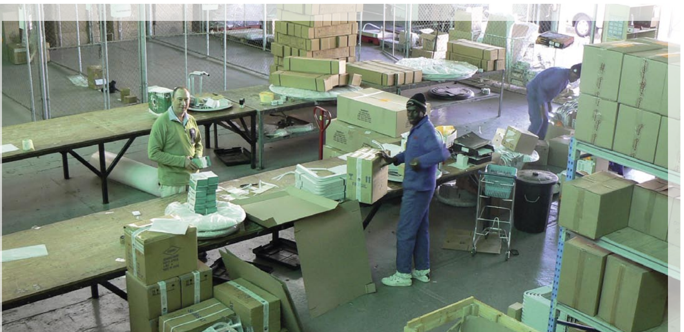
Una mirada al departamento de envíos. Aquí las órdenes de los clientes se embalan y preparan para la recogida.