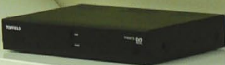
Aquí el trabajo de los ingenieros extendiendo el desarrollo de los receptores de satélite de Topfield.