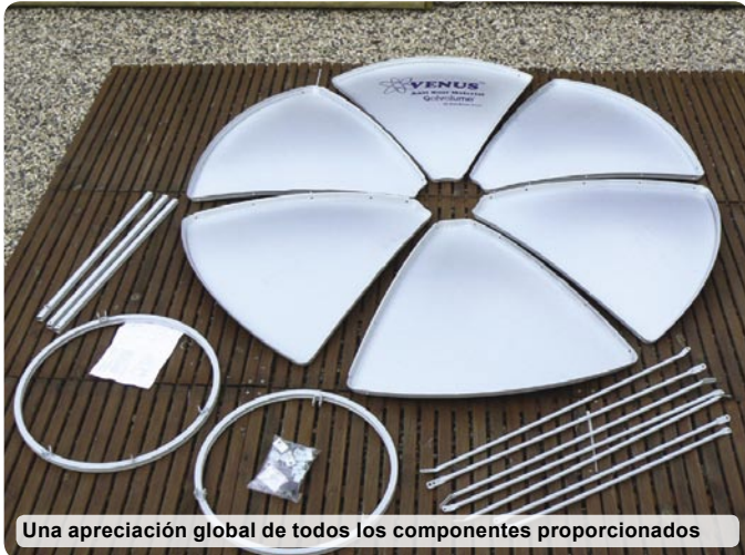
Una apreciación global de todos los componentes proporcionados