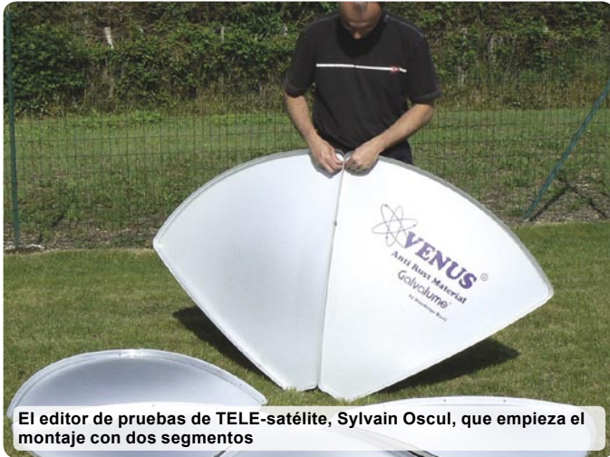
El editor de pruebas de TELE-satélite, Sylvain Oscul, que empieza el montaje con dos segmentos