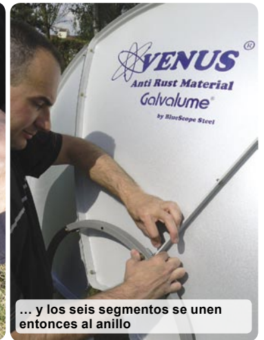
... y los seis segmentos se unen entonces al anillo