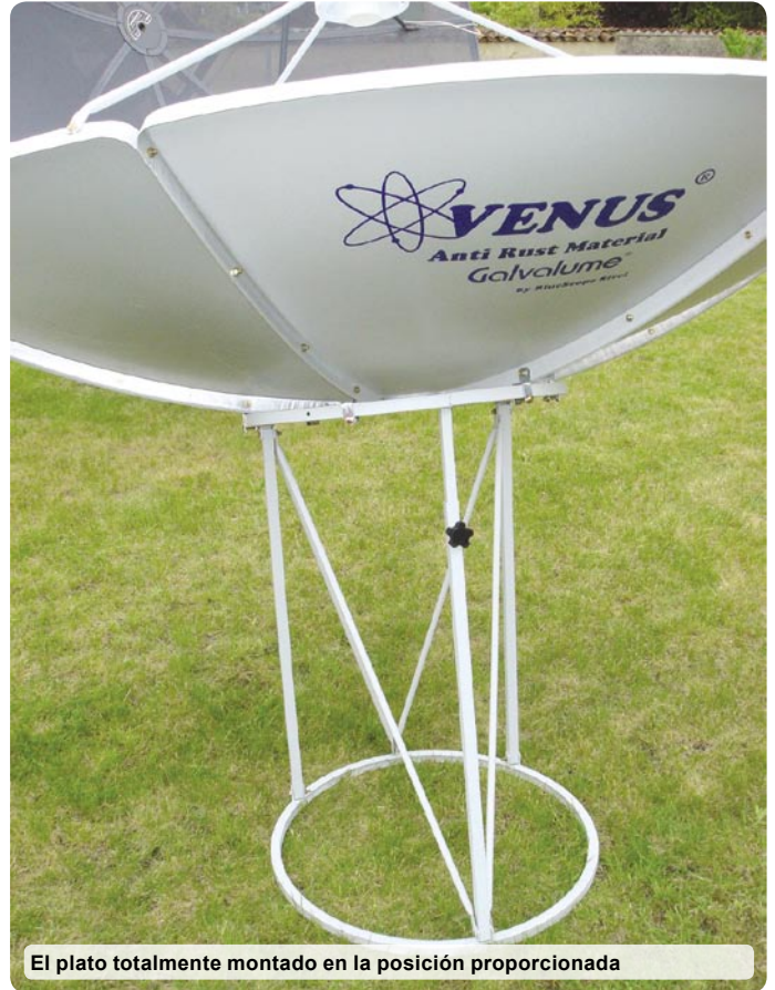
El plato totalmente montado en la posición proporcionada