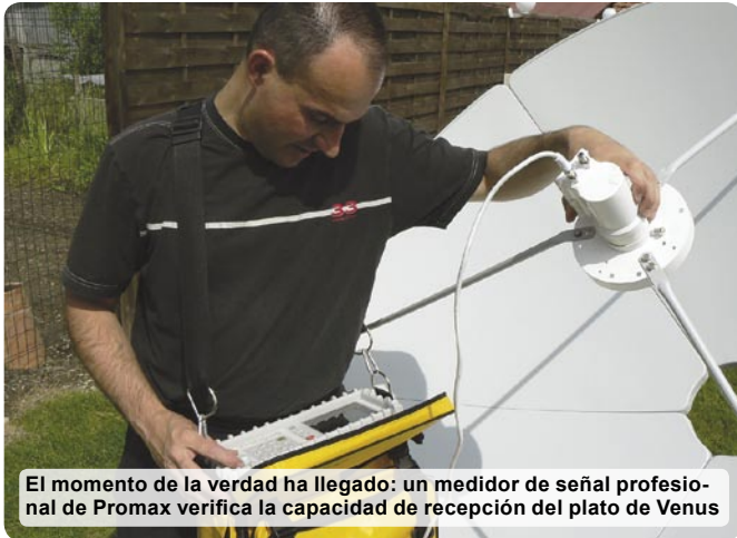
El momento de la verdad ha llegado: un medidor de señal profesional de Promax verifica la capacidad de recepción del plato de Venus