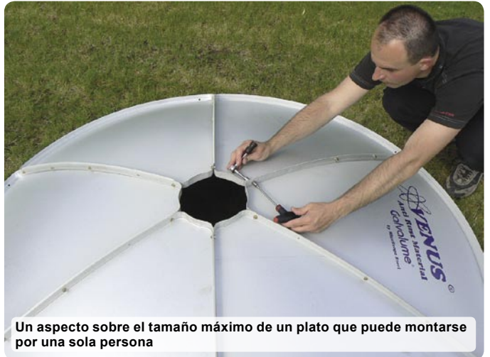
Un aspecto sobre el tamaño máximo de un plato que puede montarse por una sola persona