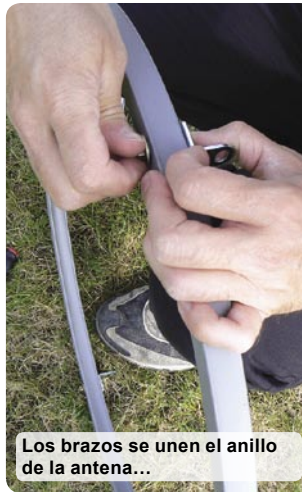
Los brazos se unen el anillo de la antena...