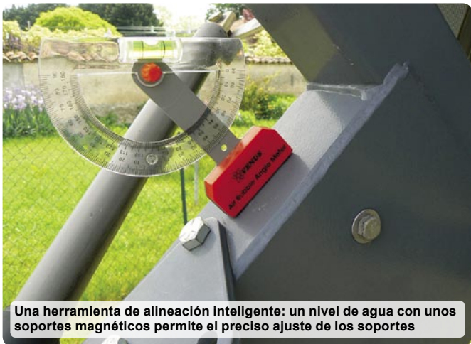
Una herramienta de alineación inteligente: un nivel de agua con unos soportes magnéticos permite el preciso ajuste de los soportes