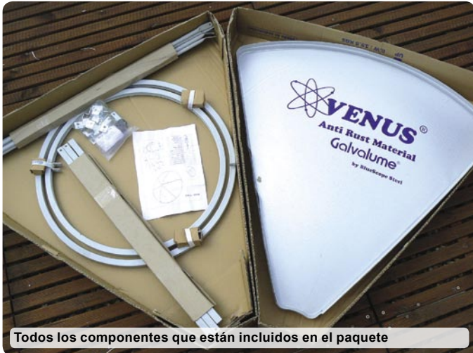
Todos los componentes que están incluidos en el paquete