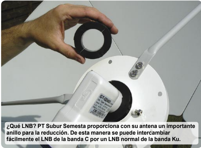
¿Qué LNB? PT Subur Semesta proporciona con su antena un importante anillo para la reducción. De esta manera se puede intercambiar fácilmente el LNB de la banda C por un LNB normal de la banda Ku.