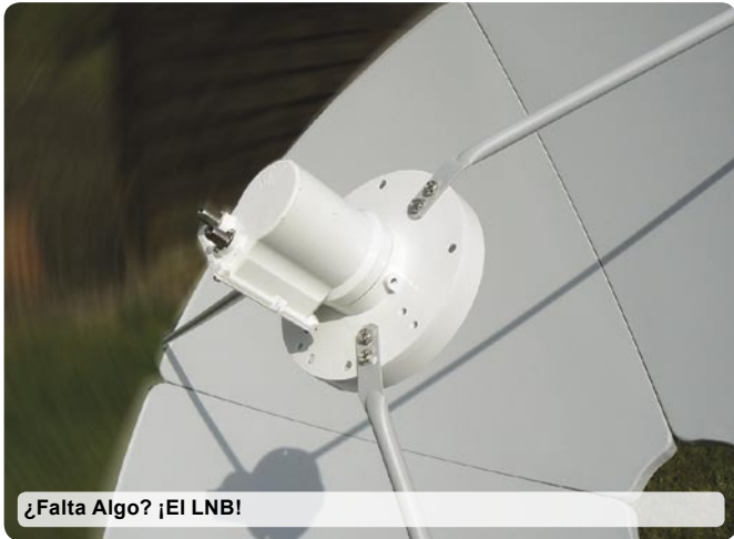
¿Falta Algo? ¡El LNB!