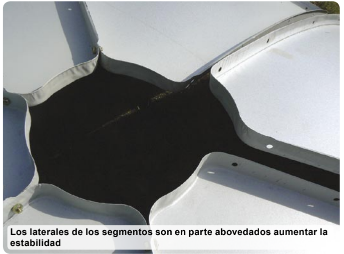
Los laterales de los segmentos son en parte abovedados aumentar la estabilidad