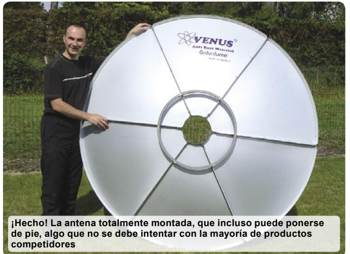
¡Hecho! La antena totalmente montada, que incluso puede ponerse de pie, algo que no se debe intentar con la mayoría de productos competidores