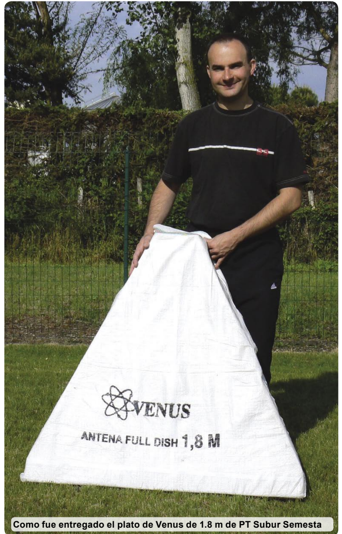
Como fue entregado el plato de Venus de 1.8 m de PT Subur Semesta

El soporte del alimento del plato de Venus está diseñado para alimentos de banda C normales que nos permitió montar en seguida un LNB de banda C de nuestro almacén técnico. Lo que nosotros no esperamos pero más apreciamos de este plato de PT Subur Semesta era el considerar el colocar los acopladores