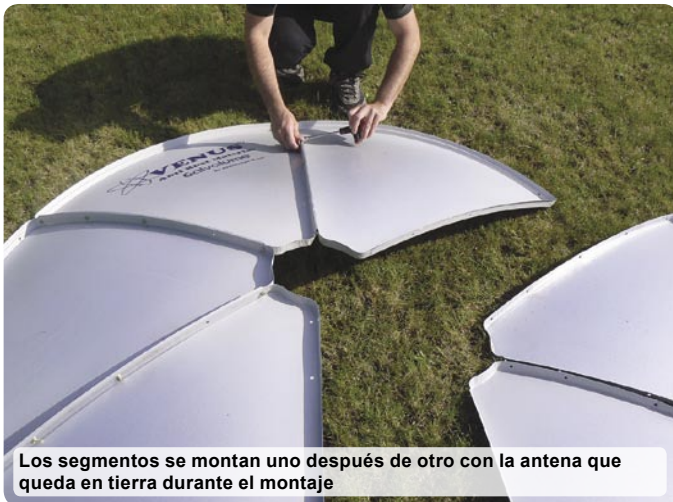
Los segmentos se montan uno después de otro con la antena que queda en tierra durante el montaje