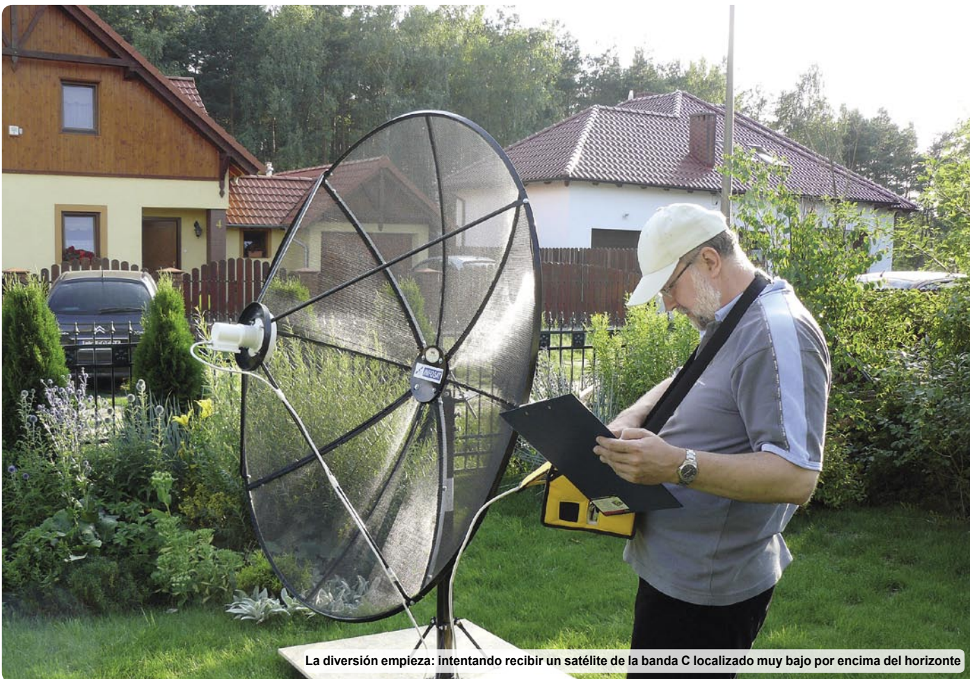
La diversión empieza: intentando recibir un satélite de la banda C localizado muy bajo por encima del horizonte

sible. Nosotros sentimos en ese momento, que nuestro centro de pruebas de TELE-satélite no estuviera localizado en el tejado de un rascacielos.