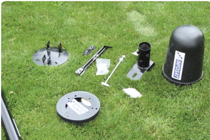
... y el resto del paquete