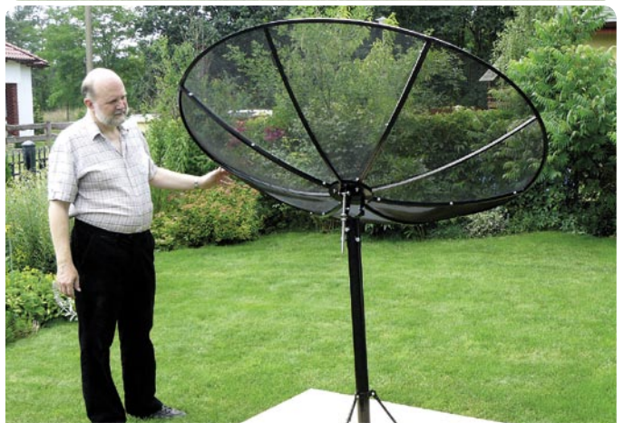
Bien hecho, todas las partes encajadas, ahora las partes electrónicas