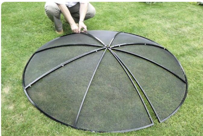
El montaje del reflector fue bastante fácil debido al muy bajo peso