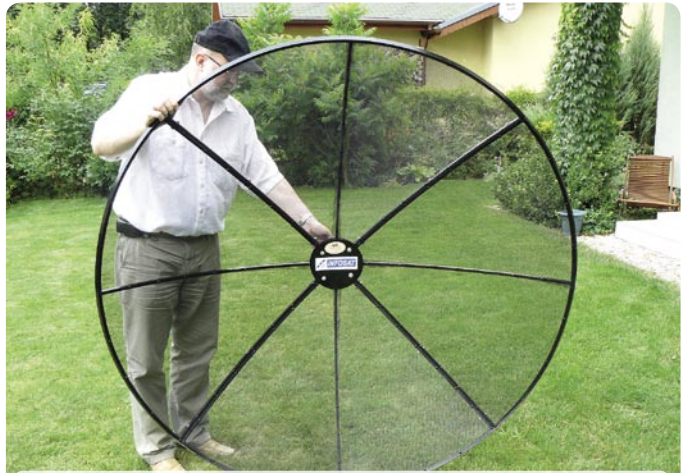
¿Todas las tuercas apretadas?