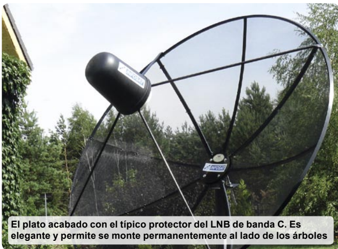
El plato acabado con el típico protector del LNB de banda C. Es elegante y permite se monte permanentemente al lado de los árboles