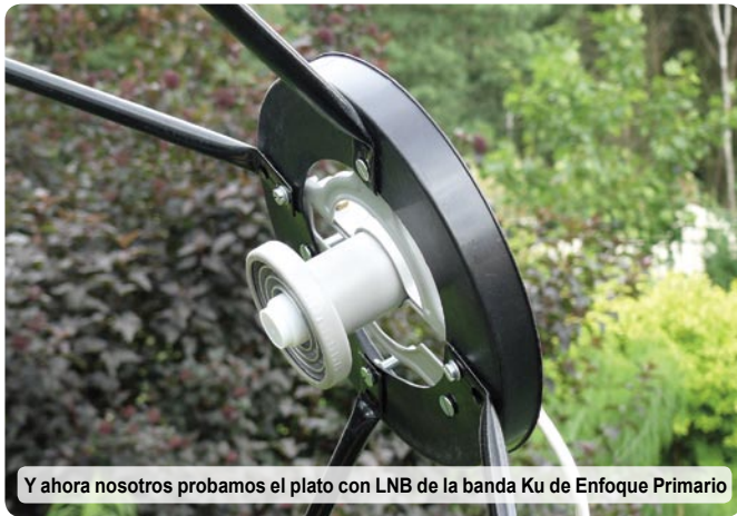
Y ahora nosotros probamos el plato con LNB de la banda Ku de Enfoque Primario

El V055 es un plato de malla ligero que puede erigirse fácilmente en un jardín. Su tamaño de 1.65m de diámetro es el mínimo requerido en Europa para la recepción de la banda C, pero es suficiente en otras regiones con satélites de banda C de gran potencia. La ventaja del V055 es la facilidad de montaje, y que encaja fácilmente en un jardín. Su uso es mejor como un plato fijo para un satélite de banda C de gran potencia.