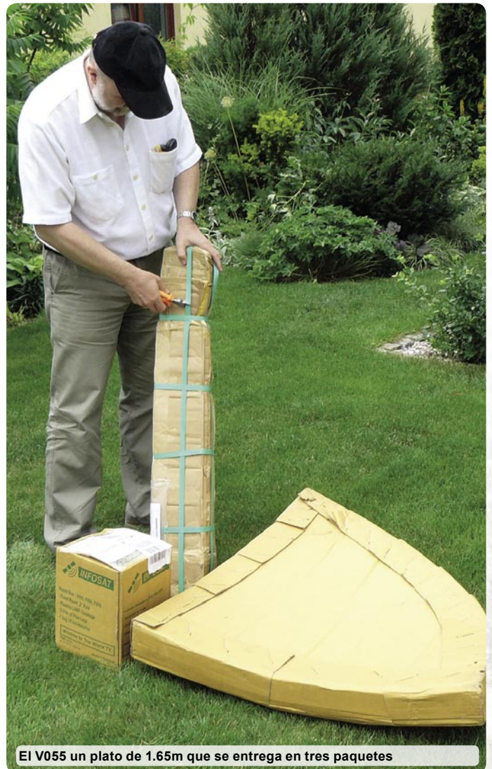
El V055 un plato de 1.65m que se entrega en tres paquetes

El montaje de las cuatro partes del reflector fue muy fácil. Nosotros lo hicimos rápidamente y pasamos a una parte más engorrosa, la preparación de una base provisional para el mástil de la antena. Afortunadamente, un pedazo de madera nos estaba esperando precisamente en nuestro garaje para ello. Como sabios, nosotros no lo tiramos. Nosotros podríamos justificar finalmente por qué hay tantas cosas extrañas que se cubren de polvo en nuestro garaje. Después de agregar los cuatro brazos ajustables, nosotros podríamos usar la tabla como una base horizontal para el mástil. Nosotros sujetamos el reflector al mástil con los tres brazos incluidos en el paquete. El montaje del reflector en el mástil no podría ser más fácil.