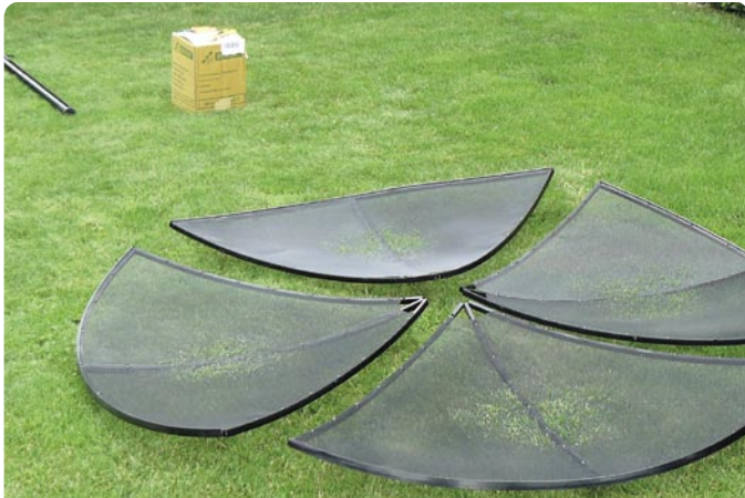
Se desempaquetan las partes del reflector...