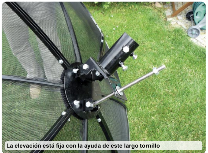
La elevación está fija con la ayuda de este largo tornillo