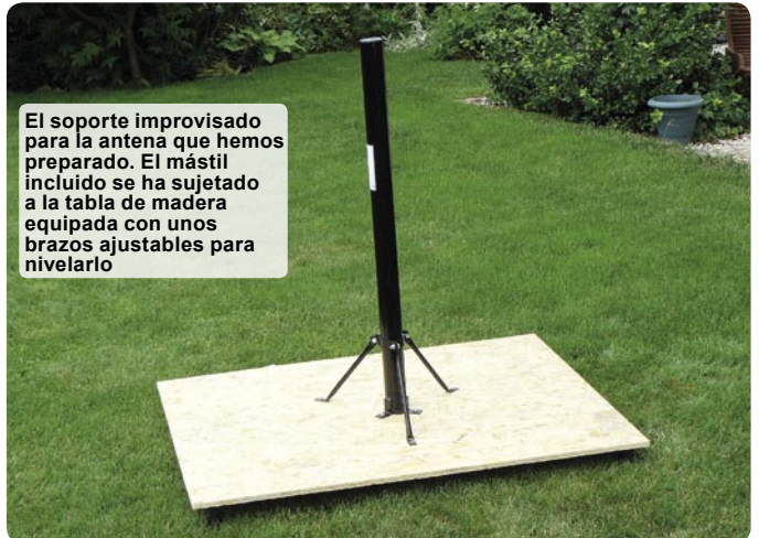
El soporte improvisado para la antena que hemos preparado. El mástil incluido se ha sujetado a la tabla de madera equipada con unos brazos ajustables para nivelarlo