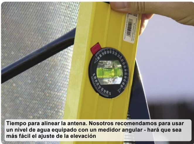
Tiempo para alinear la antena. Nosotros recomendamos para usar un nivel de agua equipado con un medidor angular - hará que sea más fácil el ajuste de la elevación