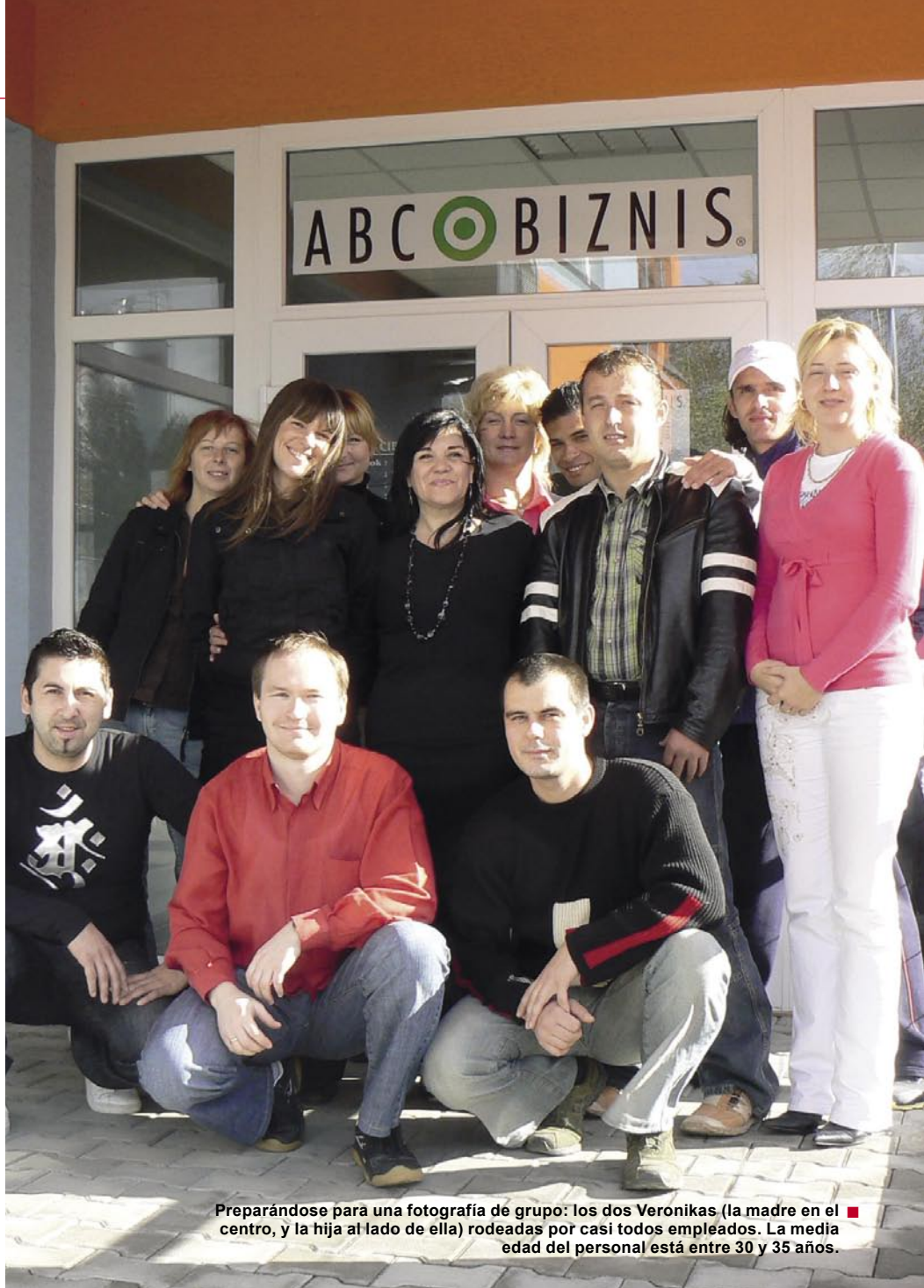
Preparándose para una fotografía de grupo: los dos Veronikas (la madre en el centro, y la hija al lado de ella) rodeadas por casi todos empleados. La media edad del personal está entre 30 y 35 años.

ABC BIZNIS ha sido un desarrollo de gran éxito desde 2004. En aquel entonces las ganancias en Euros fueron del 0.5% del total facturado, comparado con el 40.5% en el 2008.