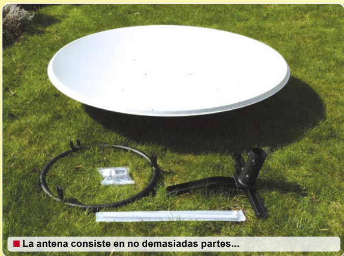
■ La antena consiste en no demasiadas partes...