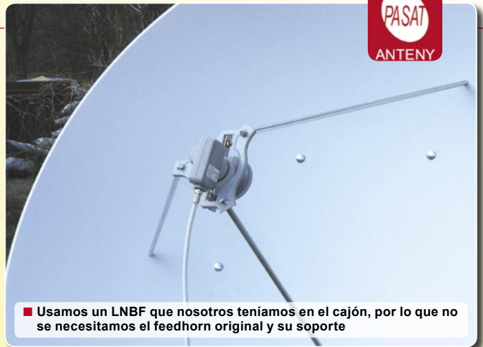
■ Usamos un LNB que nosotros teníamos en el cajón, por lo que no se necesitamos el feedhorn original y su soporte