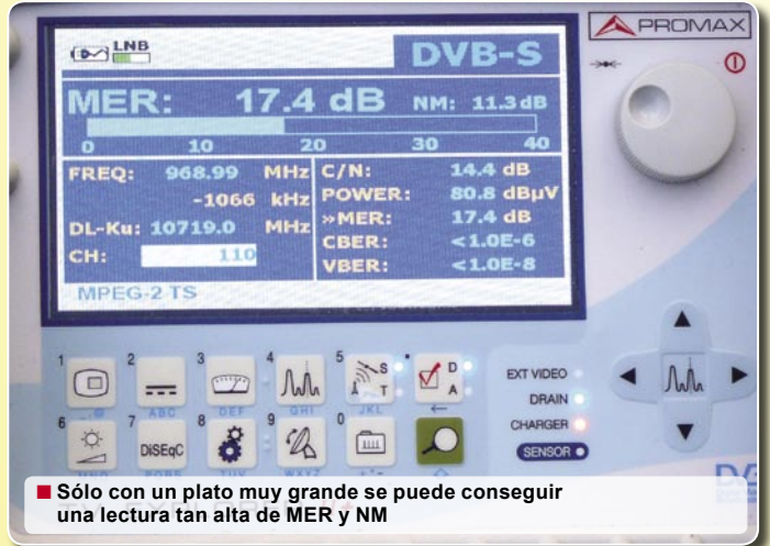
■ Sólo con un plato muy grande se puede conseguir una lectura tan alta de MER y NM