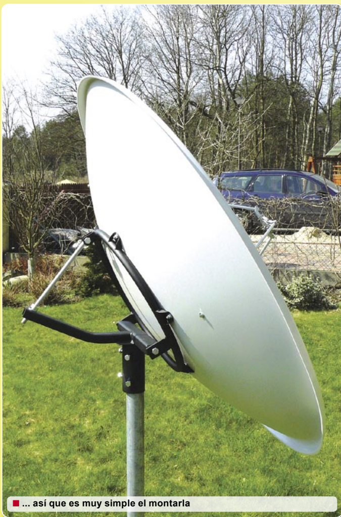
■ ... así que es muy simple el montarla

Necesité un martillo y una palanca para abrir la caja y sacar de ella los componentes de la antena. Cada parte del equipo estaba envuelta muy cuidadosamente con una lamina de protección. No había ninguna oportunidad para el más mínimo roce en el transporte. Me gustó realmente eso. Sólo un equipo profesional dispone de tal atención. Cuando todo estuvo desempaquetado, noté que habían pocos componentes. Bueno, pensé, deberá ser simple montarlo.