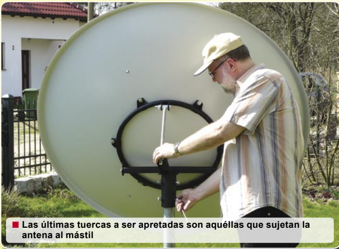
■ Las últimas tuercas a ser apretadas son aquellas que sujetan la antena al mástil