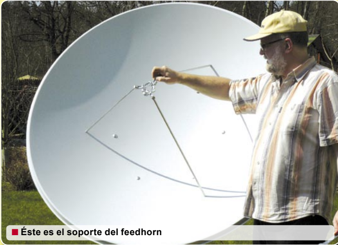
■ Éste es el soporte del feedhorn