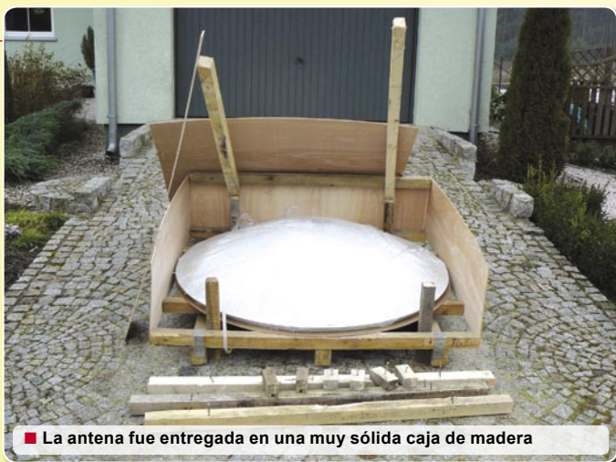
■ La antena fue entregada en una muy sólida caja de madera