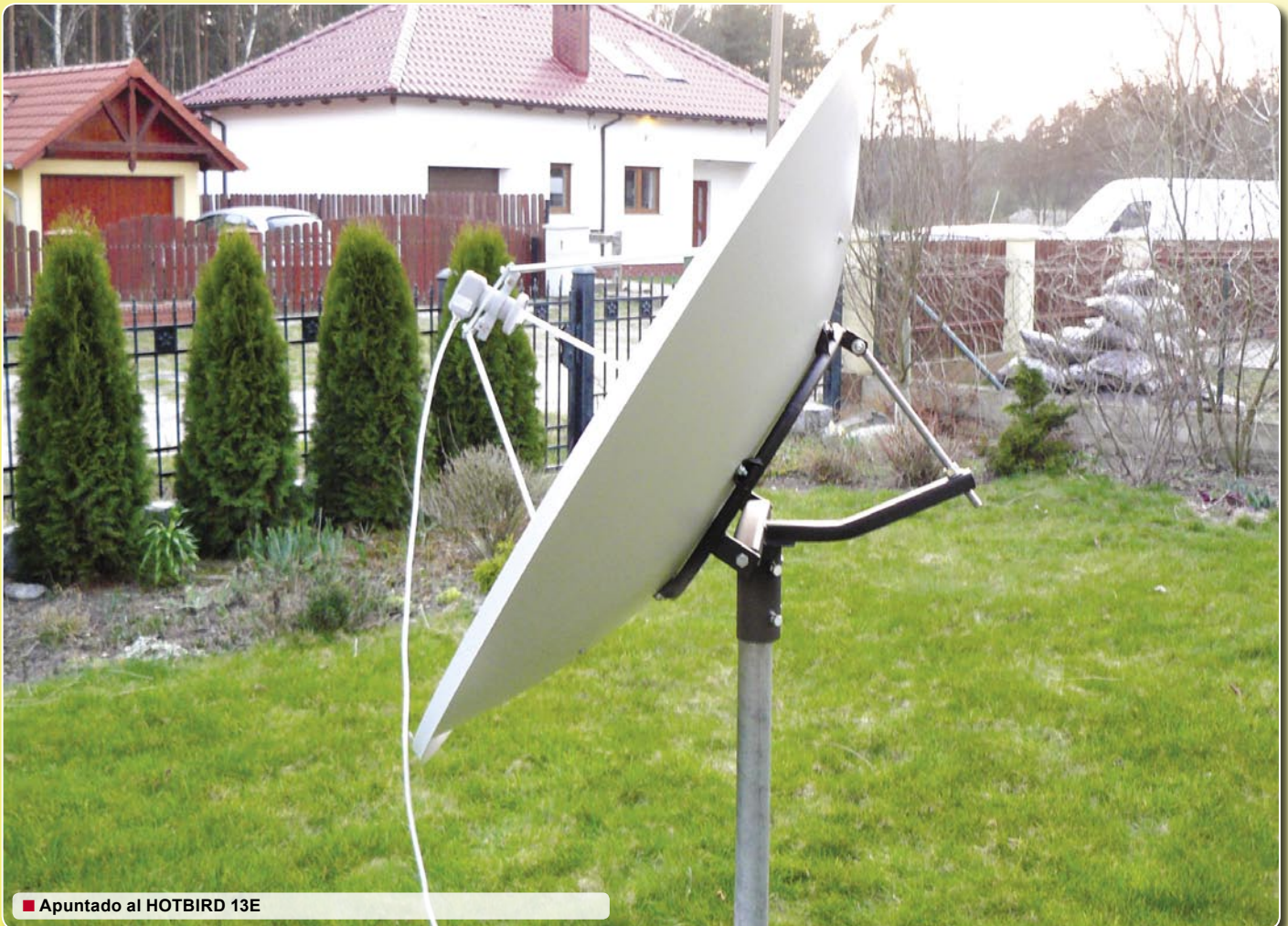
■ Apuntado al HOTBIRD 13E