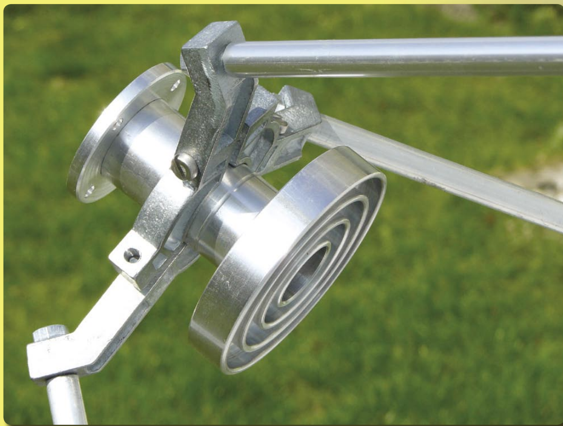
■ El feedhorn está incluido en el equipamiento de la antena