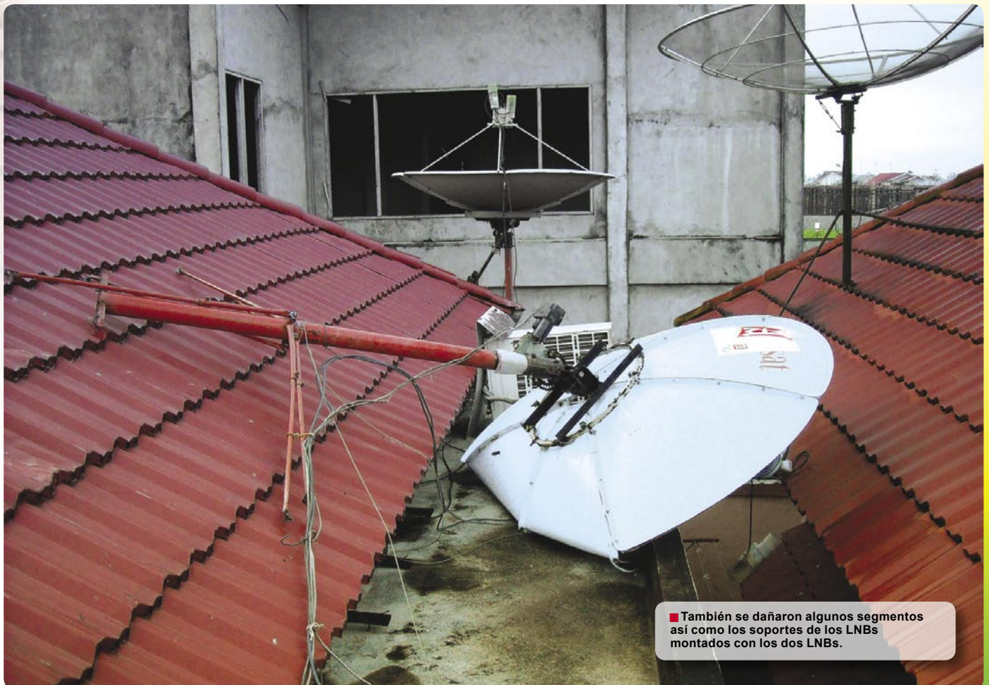
■ También se dañaron algunos segmentos así como los soportes de los LNBS montados con los dos LNBS.