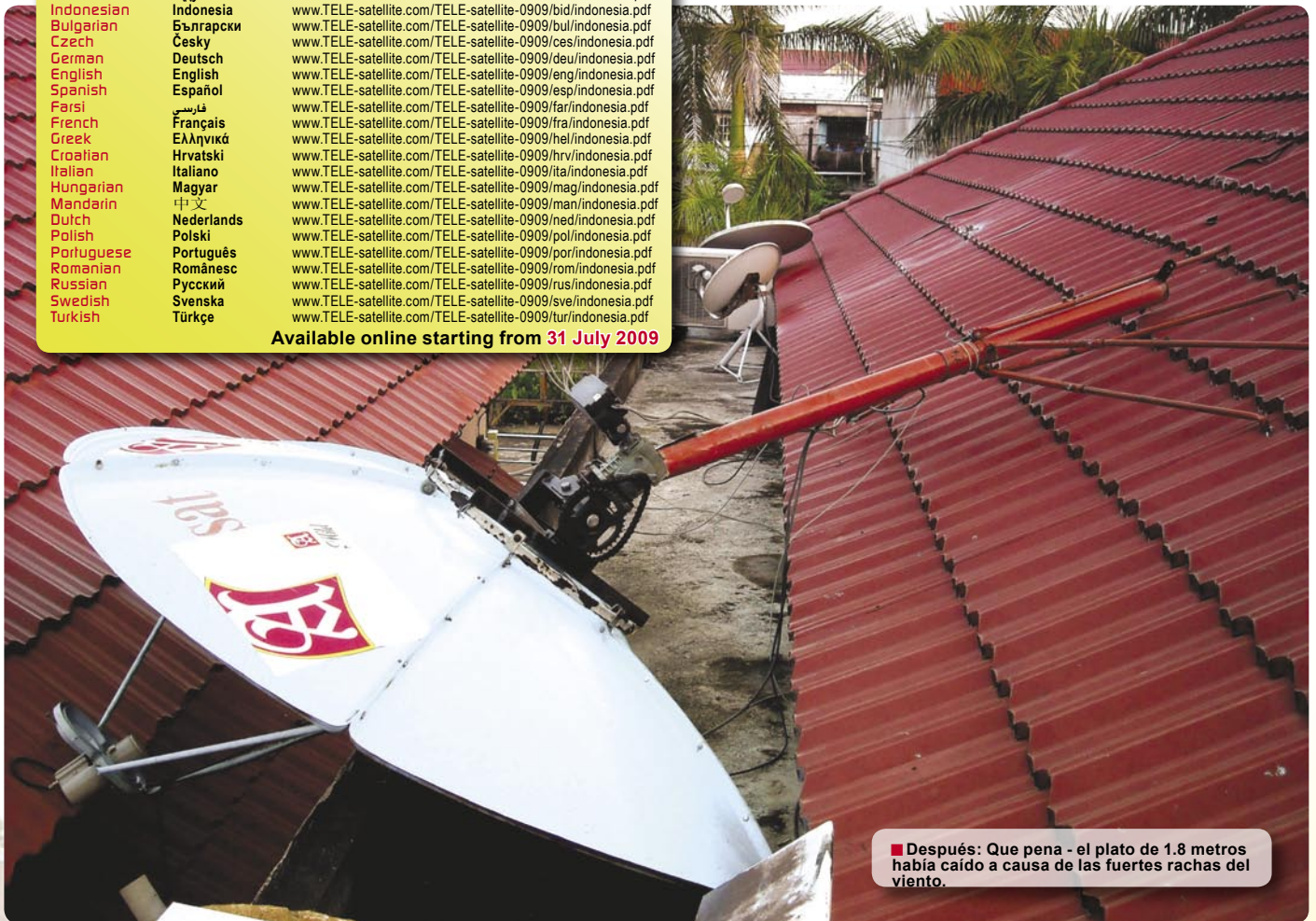
■ Después: Que pena - el plato de 1.8 metros había caído a causa de las fuertes rachas del viento.

Available online starting from 31 July 2009